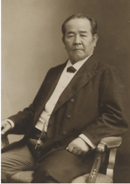
渋沢栄一

Kihin Kai: Shibusawa Eiichi and The Welcome Society of Japan