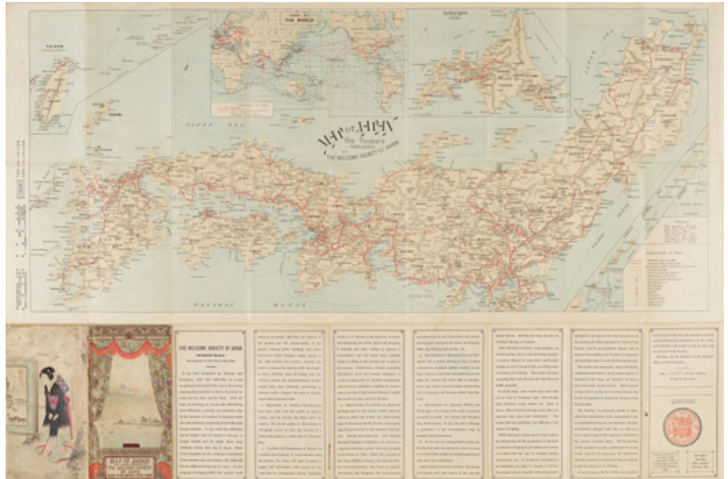
MAP OF JAPAN FOR TOURISTS (The Welcome Society of Japan 1897年)

[表面資料] USEFUL NOTES AND ITINERARIES FOR TRAVELLING IN JAPAN Sixth edition, revised (The Welcome Society of Japan 1907年)