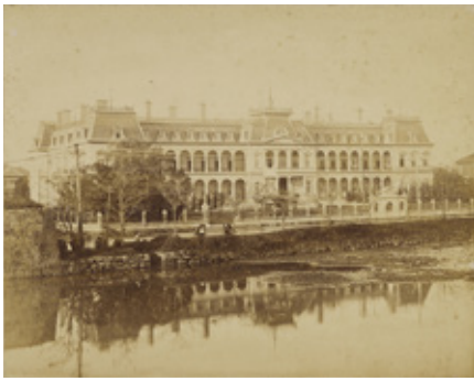
帝国ホテル (年未詳)